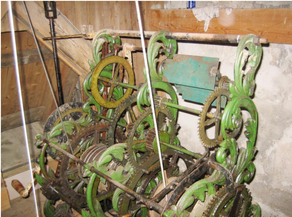
Afbeelding 2 Schuin van boven gezien aan de kant van het slagwerk