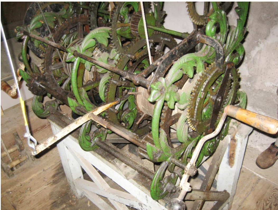
Afbeelding 3 Onderstuk schuin gezien aan de kant van het slagwerk