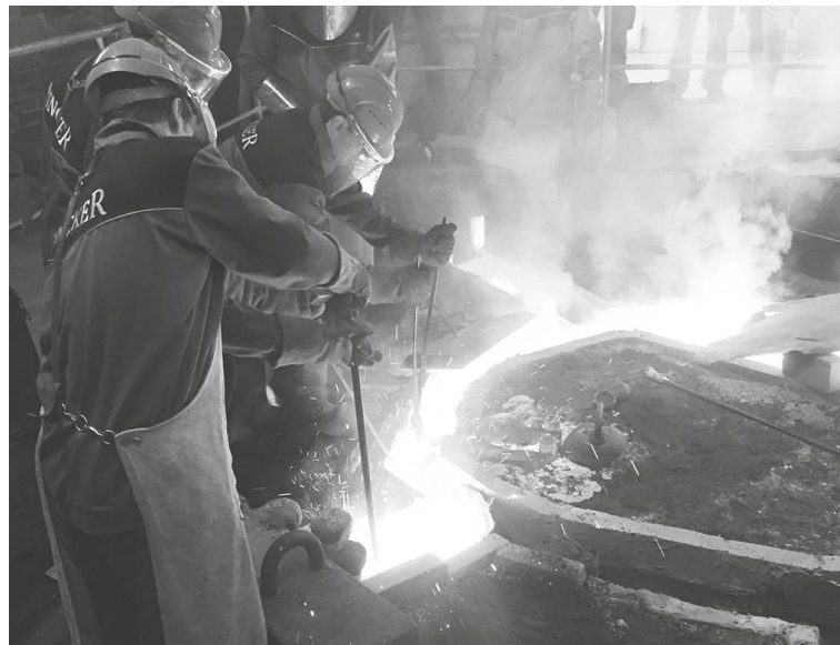
Het gieten van de klok op 4 september 2020 bij de firma Rincker in Sinn.